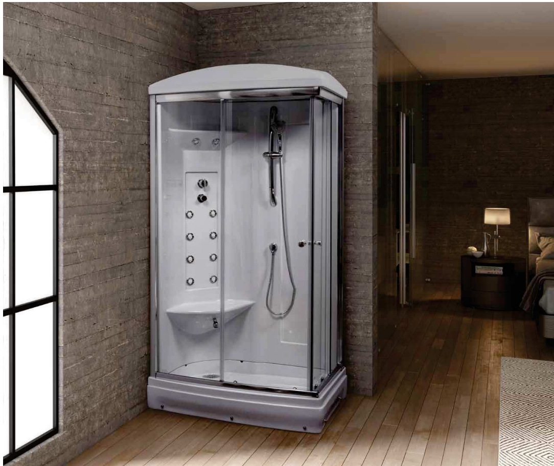
/ Serie Acrílico / Cabinas_Shower boxes_Cabines de douche