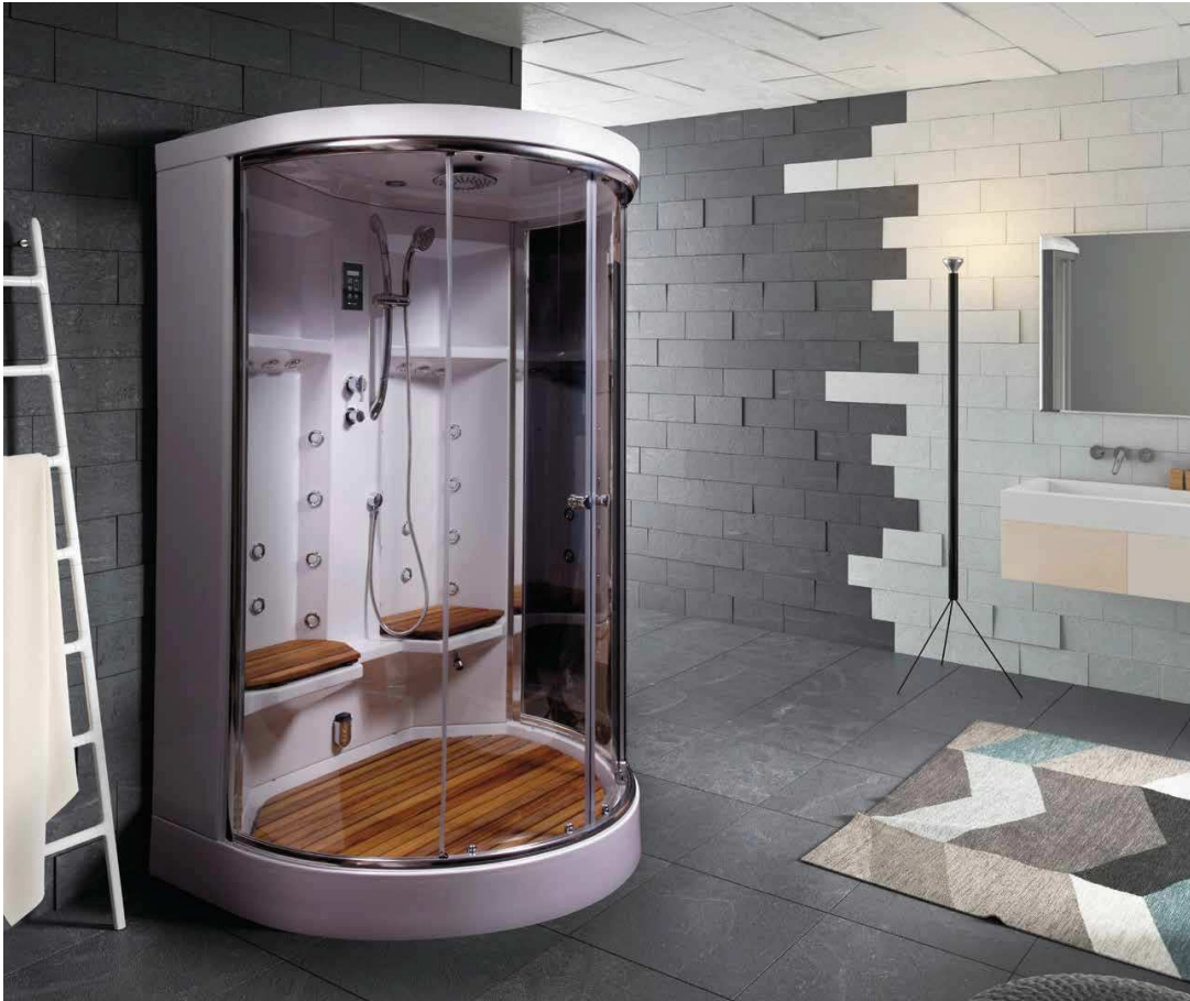
/ Serie Acrílico / Cabinas Shower boxes / Cabines de douche